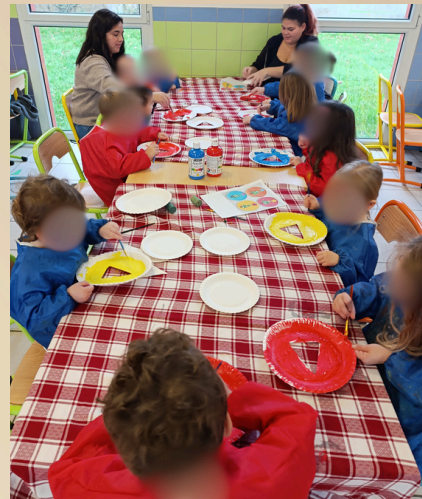
Avec le centre de loisirs