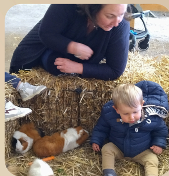
Sortie à la ferme pédagogique "Les enchanteurs du marais"