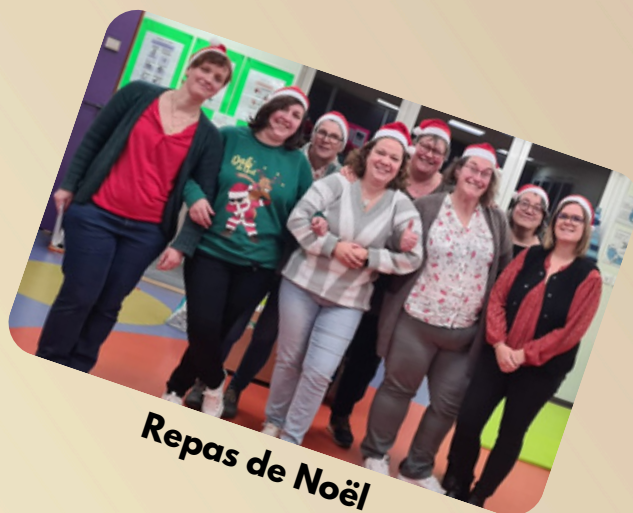
Repas de Noël