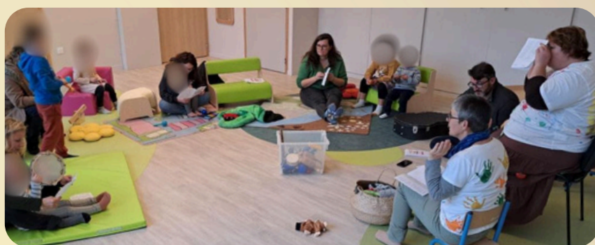
Journée des assistants maternels