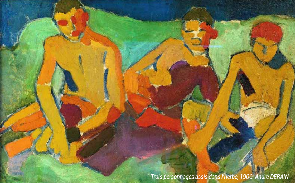
Trois personnages assis dans l'herbe, 1906. André DERAIN