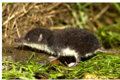
La Musaraigne aquatique Espèce protégée