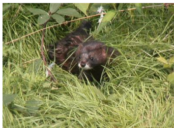
Le Vison d'Europe Espèce protégée à ne pas confondre avec le Vison d'Amérique

En cas de capture accidentelle d'une de ces espèces, vous devez relâcher l'animal. Si vous rencontrez des soucis d'identification, vous pouvez contacter la FREDON, la FDC 14 ou l'OFB.