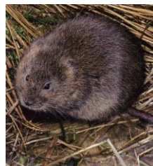
Le Campagnol amphibie Espèce protégée à ne pas confondre avec des rats musqués juvéniles