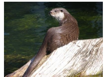
La Loutre d'Europe Espèce protégée