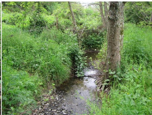
Figure 1: ruisseau de l'Orgueil à Malherbe-sur-Ajon