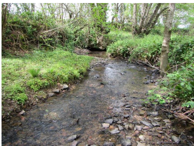
Figure 2: Douvette à Bonnemaïson

*En France, 75% du réseau hydrographique est composé par ces petits cours d'eau de tête de bassin.